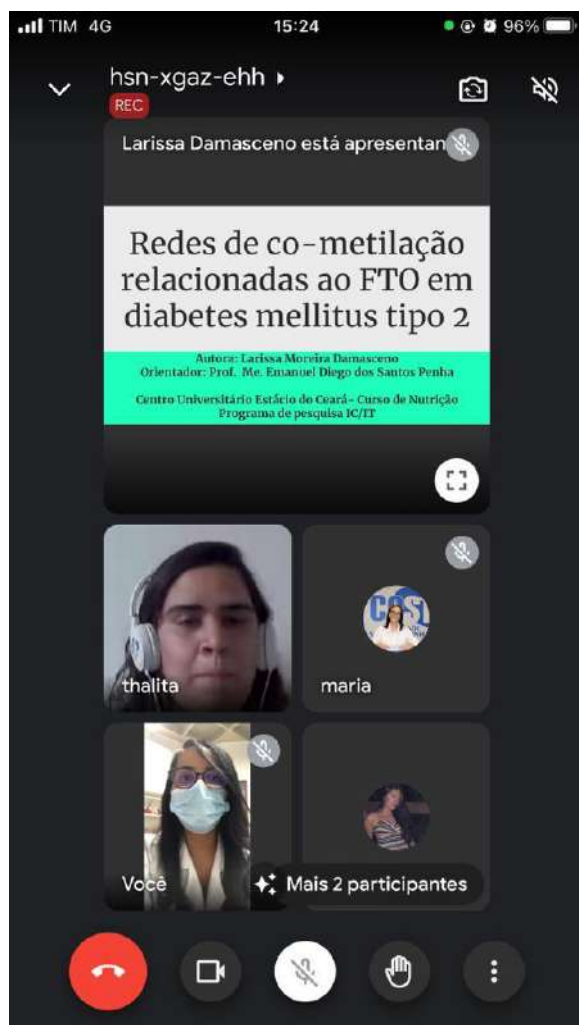
Premiação de Trabalhos Acadêmicos (XI Jornada de Nutrição da Faculdade Santa Terezinha - CEST)